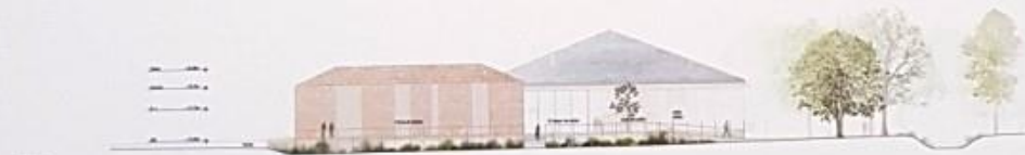
Élévation Est alt. 100'