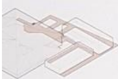
Extension dans l'axe principal vers le théâtre